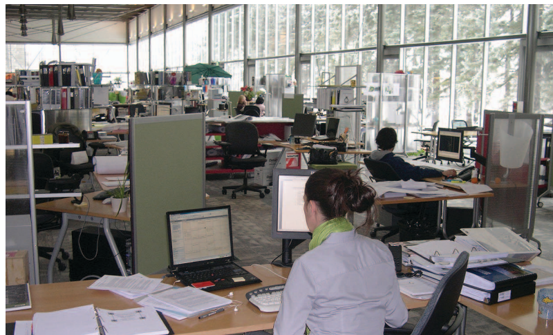
Bureaux de Smith Carter Architects | Architecte : Smith Carter Architects and Engineers Incorporated

Le programme d'études supérieures en architecture sera lancé progressivement à compter de l'automne 2010 et toutes les parties intéressées seront informées de la mise en ligne des cours.